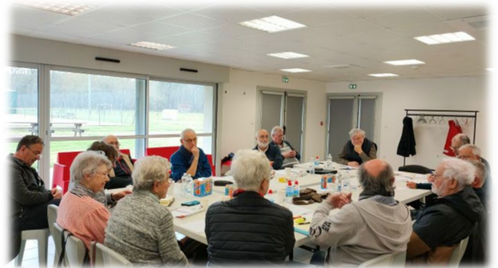
Territoire Porte du Médoc

Autre sujet important, le logement avec l'application de la loi SRU (Solidarité et Renouvellement Urbains)