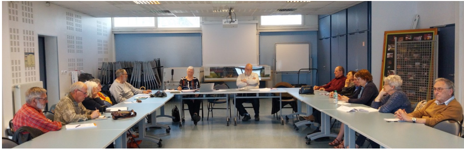
Territoire des Hauts de Garonne