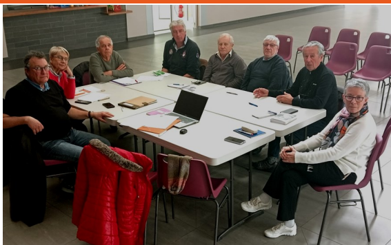
Territoire du Médoc

Dans certains territoires les déserts médicaux causent une grande inquiétude. Les médecins ne veulent pas se déplacer pour assurer des visites à l'hôpital. Autre problème les transports en ambulance.