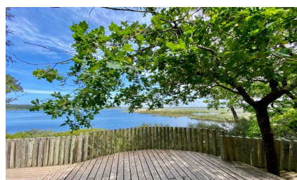
Etang du Cousseau

Le 6 juin : nous nous retrouverons, le matin, pour une randonnée à proximité du lac de Lacanau . Après un repas musical nous nous rendrons, l'après-midi, à la réserve naturelle de l'Etang du Cousseau .